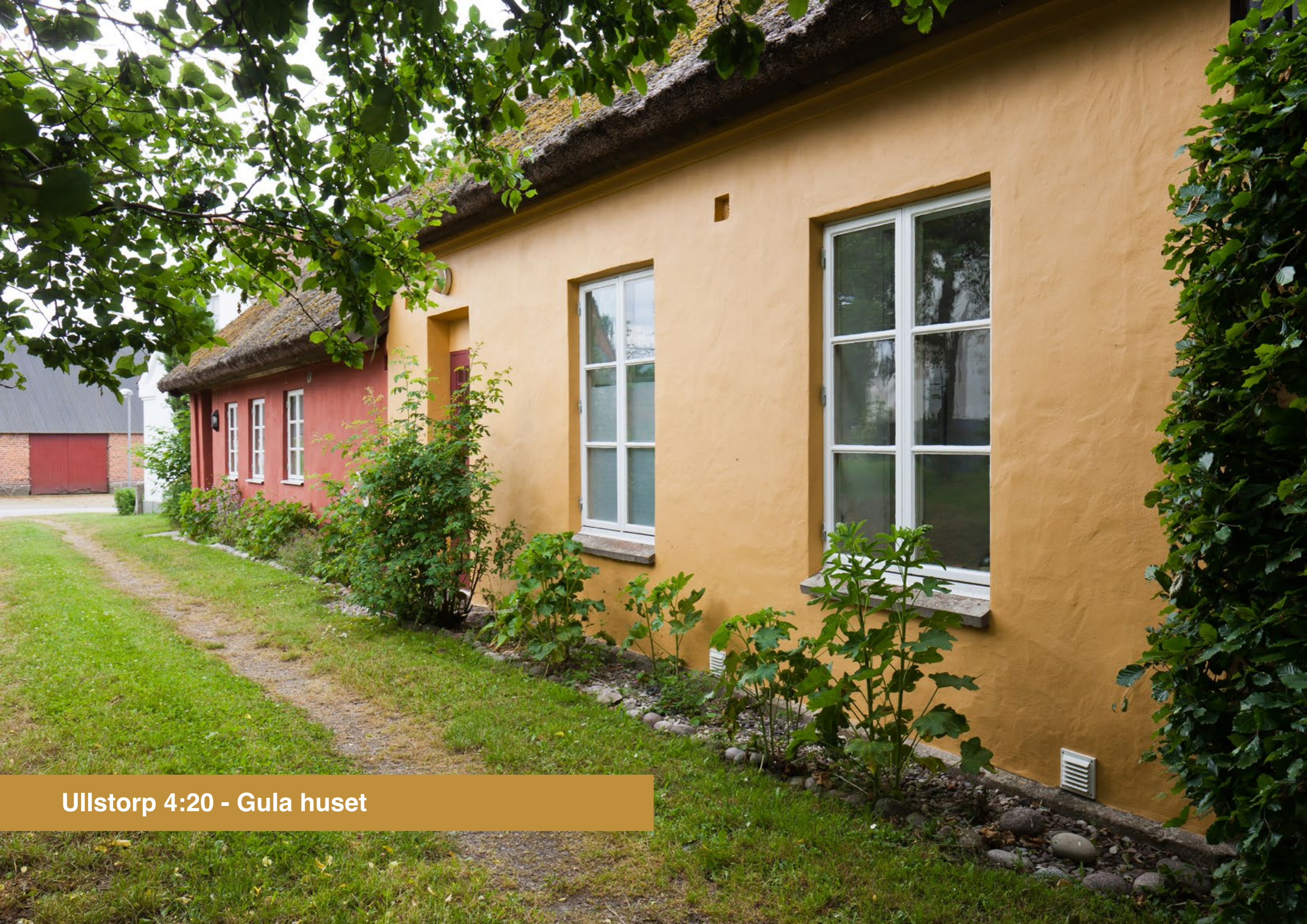
Ullstorp 4:20 - Gula huset