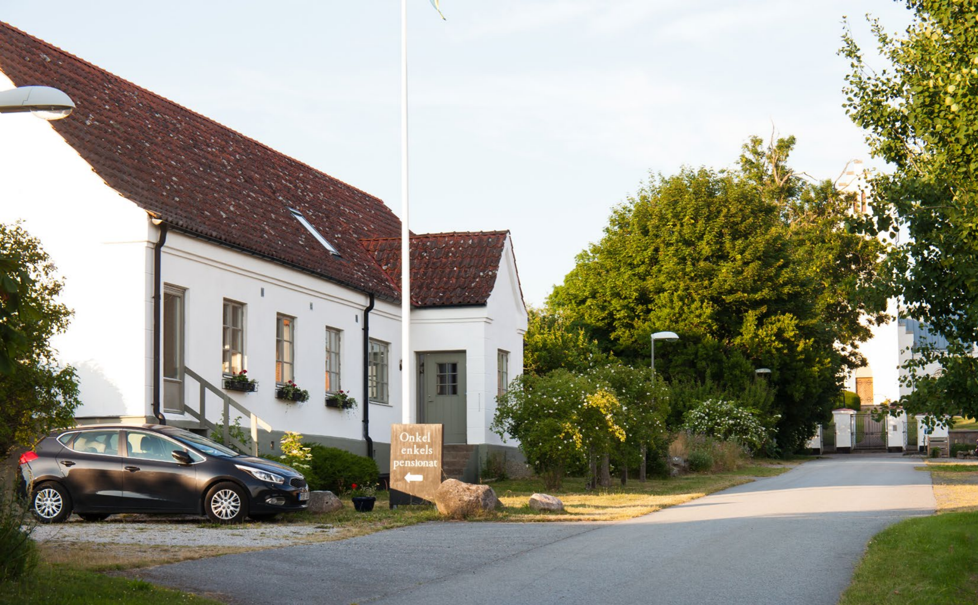
Ullstorp 4:20 - Vita huset