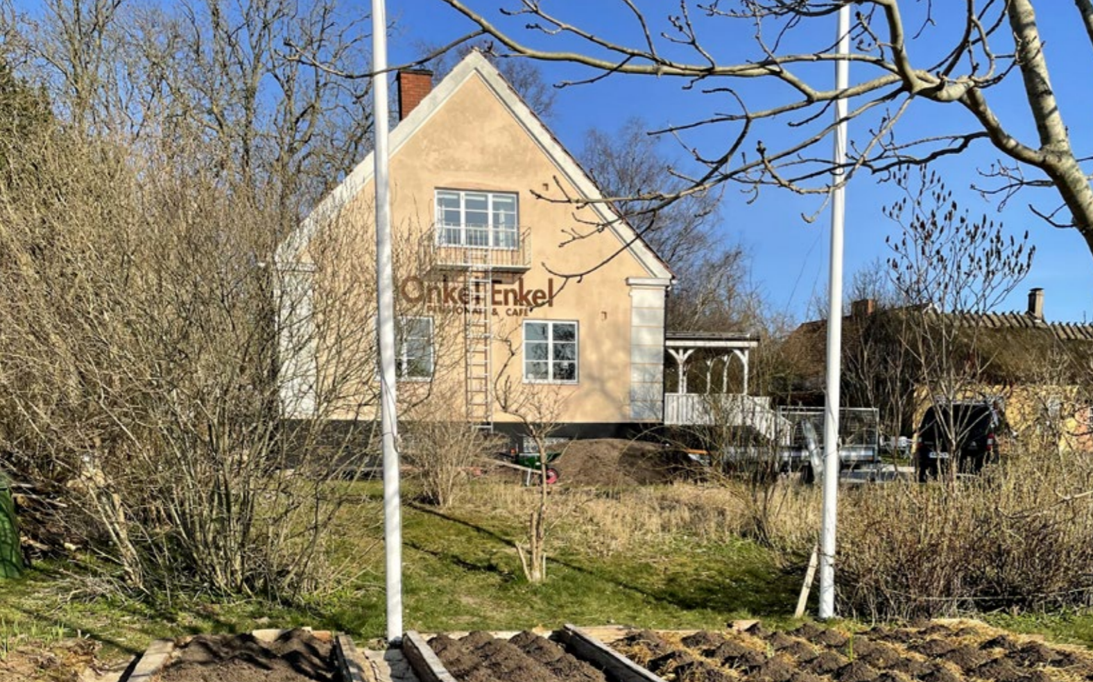
Ullstorp 4:20 - Huvudbyggnaden